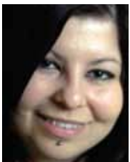
PAR STÉPHANIE BERNARD

Que connaissons-nous sur les félins ? Ce sont des mammifères de la famille des carnivores. Leurs traits particuliers sont leur tête ronde au crâne raccourci, leur mâchoire dotée d'une trentaine de dents, et leurs griffes rétractables (exception : guépard, chat viverrin et chat à tête plate). Une singularité : ils sont digitigrades, c'est-à-dire qu'ils marchent sur leurs doigts, la plante des pieds ne se posant pas sur le sol.