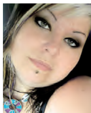
PAR STÉPHANIE BERNARD