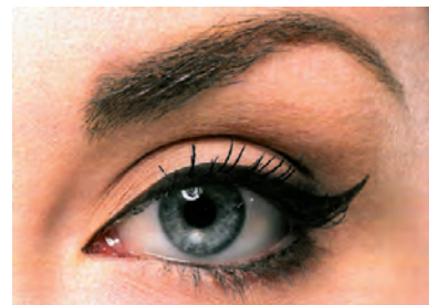
Dita von Teese