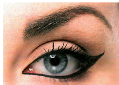
Lana Del Rey

Tous ces tracés d'eyeliner sont basés sur le modèle de l'œil de biche. À travers ces exemples, il est clair que l'œil de biche a évolué avec le temps. Court et épais pour Audrey Hepburn, il est plus fin et plus long pour Marilyn Monroe (ce qui allonge plus le regard) ; Brigitte Bardot le porte légèrement plus épais que Marilyn Monroe mais sa pointe est plus haute afin de remonter davantage le regard ; quant à