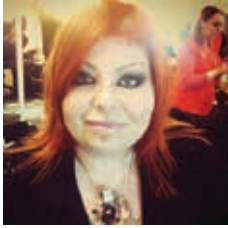
Par Stéphanie Bernard