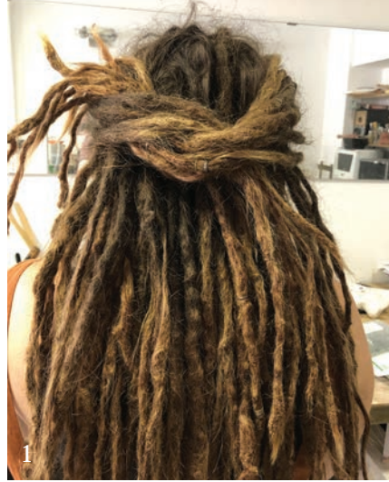
Photo 1 : vous constaterez ici le volume conséquent des fameuses dread-