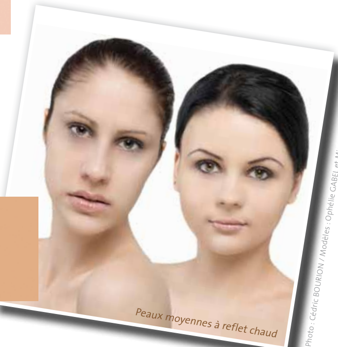
Peaux moyennes à reflet chaud

Certaines peaux de couleur moyenne peuvent avoir un reflet froid mais cela est assez rare. Dans ce cas, elles présentent un reflet légèrement bleuté au niveau du cou, des tempes ou autour de la bouche.