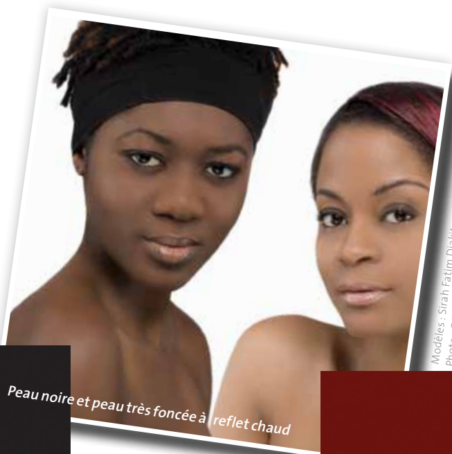
Peau noire et peau très foncée à reflet chaud

Les peaux mates sont toujours à reflet chaud. Elles sont plus foncées que les peaux moyennes car elles sont bronzées. La peau ne rougit pas du tout au soleil. Ce type de peau est implanté au nord du Mexique, au nord de l'Argentine, au sud de l'Afrique, en Algérie, en Tunisie, en Chine et au centre de l'Australie.