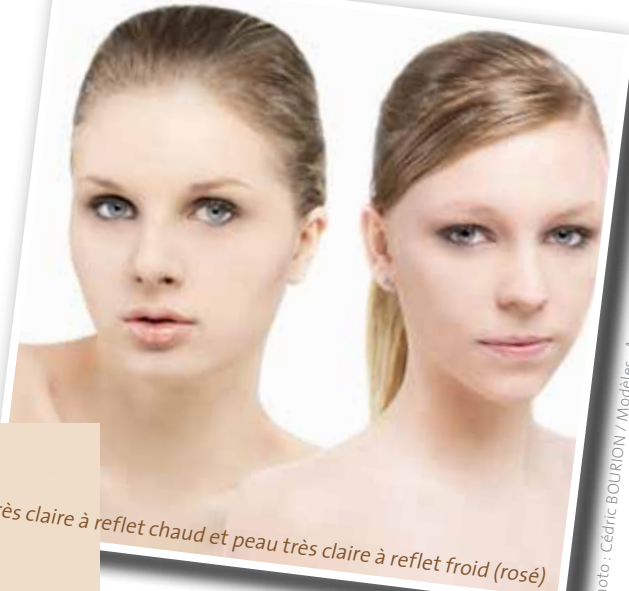
Peau très claire à reflet chaud et peau très claire à reflet froid (rosé)

Ces teints ont généralement des reflets neutres. La couleur des cheveux est très foncée (quasiment noire) ou blond très clair et les cernes sont bleutés. Ce type de peau est généralement fragile face au soleil, il ne bronze que très peu et peut être sujet aux taches pigmentaires. On trouve les peaux très claires à reflet neutre dans les pays situés très loin de l'équateur. Certaines peaux de couleur très claire peuvent avoir un reflet froid mais cela est assez rare. Dans ce cas, elles présentent un reflet rosé sur l'ensemble du visage.