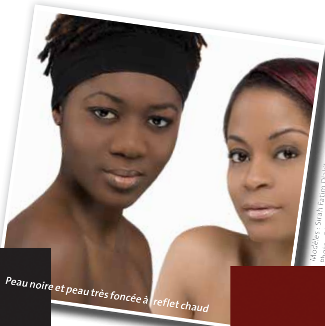
Peau noire et peau très foncée à reflet chaud

Les peaux mates sont toujours à reflet chaud. Elles sont plus foncées que les peaux moyennes car elles sont bronzées. La peau ne rougit pas du tout au soleil. Ce type de peau est implanté au nord du Mexique, au nord de l'Argentine, au sud de l'Afrique, en Algérie, en Tunisie, en Chine et au centre de l'Australie.