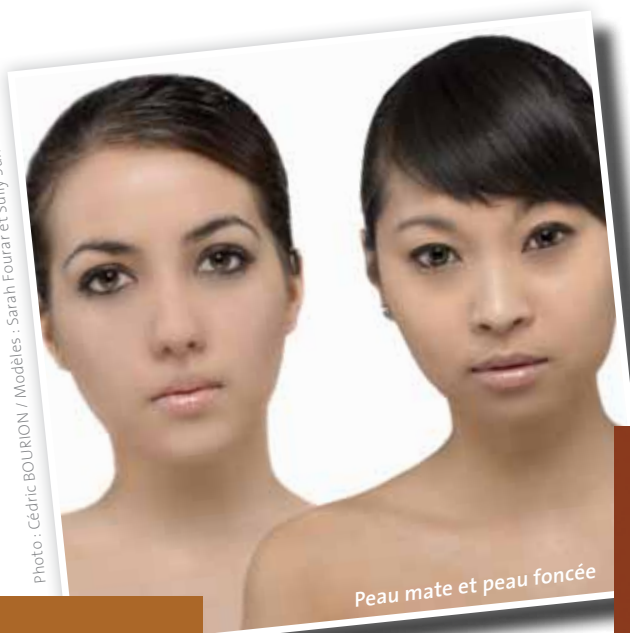
Peau mate et peau foncée